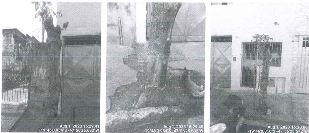
Figura 1 – Amoreira danificada com sinais de anelamento e um indivíduo não identificado podado drasticamente.

Durante vistoria foi possível observar 01 (um) espécime não identificado com poda drástica e 01 (uma) amoreira ( Morus sp.) podada drasticamente com laceração ao longo do fuste, além de sinais de anelamento na base. Considerando os danos causados, encaminhamos o Relatório Técnico para o Departamento de Controle Ambiental para conhecimento e providências cabíveis. Após as tratativas, solicitamos retorno para emissão de ato autorizativo.